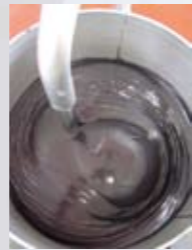
10分後 After 10 minutes.