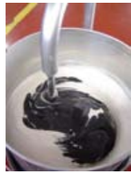
1分後 After 1 minute.