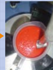
脱泡攪拌中② During mixing and defoaming