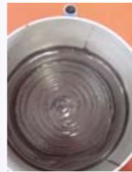
12分後終了 After 12 minutes. Work is over.