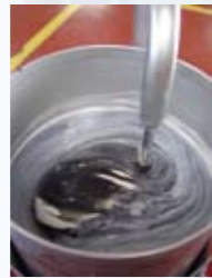
5分後 After 5 minutes.